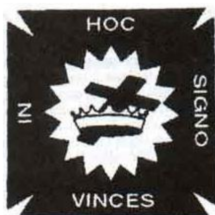
Gambar 4: Simbol The Knight Templar

(The Knight Templars were sworn to poverty, chastity, and obedience. They were obliged to cut their hair but forbidden to cut their beards, thus distinguishing themselves in an age when most men were clean shaven --Michael Baigent hlm. 63).